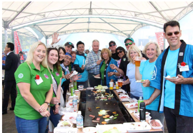
にんにくとベゴまつり