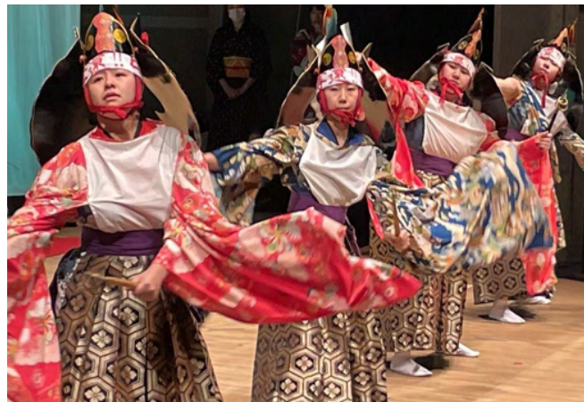
青森県無形文化遺産「田子神楽」