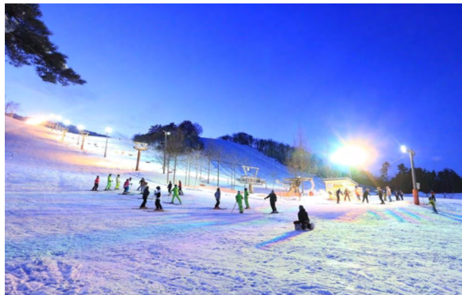
創遊村229スキーランド