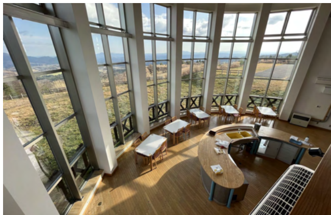
宿泊施設「ロッジカウベル」

創遊村、229スキーランドなどの観光地 人を呼ぶにんにく 3大祭り 無形民俗文化財 田子神楽